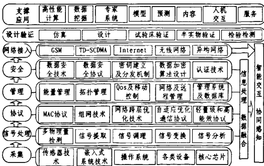
图3 物联网关键技术结构图

物联网由传感器网络、射频标签阅读装置、条码与二维码等设备以及互联网等组成。当前各项技术发展并不均衡,射频标签、条码与二维码等技术已经非常成熟,传感器网络相关技术尚有很大发展空间,本文以传感器网络为例,分析其中涉及的关键技术,其结构如图3所示。传感器网络中所包含的关键内容和关键技术主要有数据采集、信号处理、协议、管理、安全、网络接入、设计验证、智能信息处理和信息融合以及支撑和应用等方面。