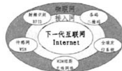
图 1 物联网概念模型

可以认为,“物联网”(Internet of Things)是指将各种信息传感设备及系统,如传感器网络、射频标签阅读装置、条码与二维码设备、全球定位系统和其它基于物物通信模式(M2M)的短距无线自组织网络,通过各种接入网与互联网结合起来而形成的一个巨大智能网络。如果说互联网实现了人与人之间的交流,那么物联网可以实现人与物体的沟通和对话,也可以实现物体与物体互相间的连接和交互。物联网的概念模型如图 1 所示。