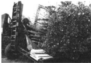
图4 树冠振摇式收获机械

机械采收一般使用强风 [12] 或强力振摇机械,迫使果实脱落,果实直接落在树下由人工捡拾,或落在树下的传送带承接果实并送至与收获机械同步前进的运输车斗内。强力振摇机械又有树干振摇 [13] 、枝干振摇 [14] 和树冠振摇 [15] 3种形式。目前使用的收获机械主要有两种类型:基于树冠振摇的连续式收获机(如图4所示);基于树干振摇的收获机(如图5所示)。主要机型由美国Coe-Collier、OXBO和Korvan公司制造。一般人工采摘柑橘的效率是0.5 t/h,而树干振摇式收获机的采收效率为10 t/h,树冠振摇式收获机的采收效率为25 t/h,但收获机械的应用可能导致10%左右的柑橘损失 [11] 。澳大利亚和西班牙等国家也在进行柑橘收获机械的研究与应用 [16-17] 。发展机械化收获,除了研究收获机械,还对适合机械收获的农艺技术进行了研究,美国为了便于机械采摘柑橘,采摘前给柑橘树喷施专用果实脱落剂 [18] ,如萘乙酸等,使柑橘果实在振摇下容易脱落。