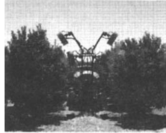
图2 新型果园喷雾机 Fig.2 Sprayer for citrus orchard

利用高光谱反射成像和光谱信息发散技术等可检测柑橘溃疡病 [10] 。自动混药和药液定量注入系统也被不少国家广泛采用并不断完善,以减少操作者与药液的接触。