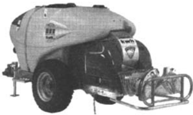
图1 静电式喷雾机 Fig.1 Electrostatic sprayer

施药机械主要有液压式、风送式和静电式喷雾机。液压式喷雾机发展较早,应用较广。风送式喷雾,可以使雾滴进一步破碎、细化,可增加雾滴的穿透能力,使作物得到全方位的喷雾,用药量大大降低。静电式喷雾机是近几年发展的机型,如图 1 所示,静电式喷雾是应用电晕充电、接触充电或感应充电原理使喷出的雾滴带电,同时,作物产生相反电位,使雾滴直接引向作物,以提高雾滴的命中率和附着性能,且分布均匀,减少漂失和环境污染,可提高