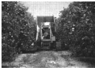
图5 树干振摇式收获机械