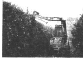
图3 整株几何修剪机 Fig.3 Pruning machine

柑橘树修剪机分为整株几何修剪机和单枝修剪机两类。整株几何修剪机是在拖拉机上安装可以上下升降、左右转动的外伸作业臂,臂端装有切割器,如图 3 所示。单枝修剪机包括各种手动修枝剪、修剪柑橘树上部枝条的高枝剪、切割较粗枝干的折叠刀式锯、动力圆盘锯和动力链锯等。目前国外使用的单枝修剪机的动力多为汽油机或气泵。剪下的树枝放在柑橘树行间,使用专门的粉碎机切断后直接铺在行间地面或抛撒到柑橘树行覆盖在地表,起到保持水分、减少杂草和提高土壤生物活性等作用。