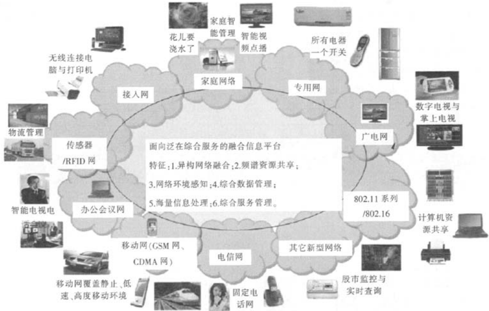
图 1 物联网全景图

物联网发展中最重要理念是融合 [3] 。物联网通过设备融合、网络融合、平台融合实现服务融合、业务融合和市场融合。设备融合指研发出一体化的感知终端。网络融合指用户可使用任意终端(移动台、PDA、PC 等)通过任一方式接入网络(WLAN、GPRS、3G 网络等),而且号码唯一、帐单唯一。平台融合指用户数据集中管理、公用的业务平台、分类的管理平台和应用平台,支撑用户跨业务系统的互操作,形成统一认证系统,实现基于统一账号、统一密码的集中认证。服务融合指在服务层面实现融合,例如在固话和移动网络之间共享收信人的地址、电话号码、用户名等。业务融合指物联网同时提供语音、数据、视频等多种业务。市场融合就是以市场机制为引导,把各类通信和信息产品和服务捆绑起来打包销售。