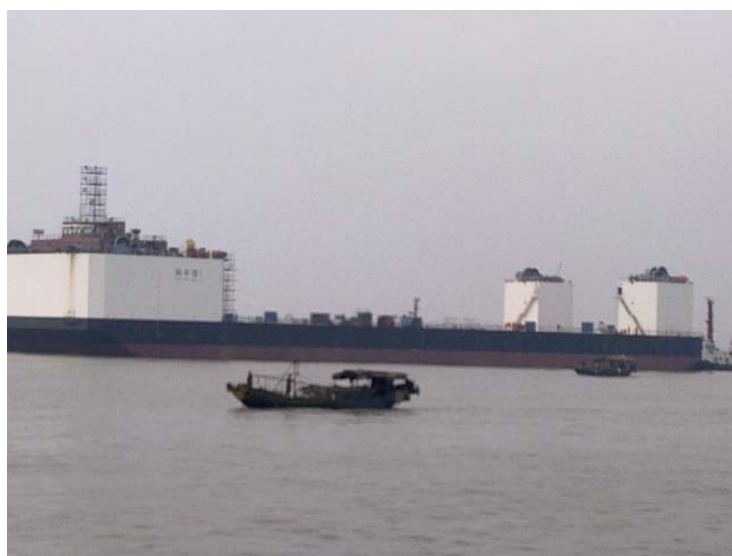
图 2 下水后的实船照片

每个压载水舱设独立空气管，主甲板以下压载舱的空气管沿主甲板大 T 排下沿敷设，并引到艏部甲板室前侧向上，出口高于最大沉深。空气管在其舱内艏艉端各设一个透气口，透气口的截面积与注入/排出管截面积相同，以保证本船无论艏倾还是艉倾都能顺利透气。每个压载舱的空气管截面积不少于该船注入/排出管截面积的 1.25 倍。